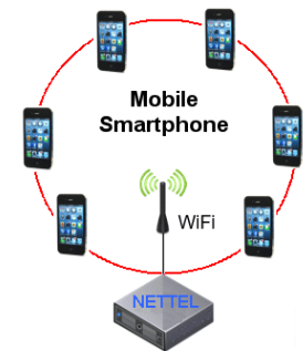
NETTEL usato come sistema di collegamento da campo con Smartphone Android